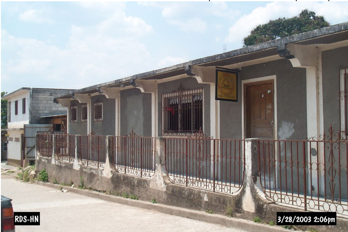
Local para el CCCC del municipio de Lepaera.